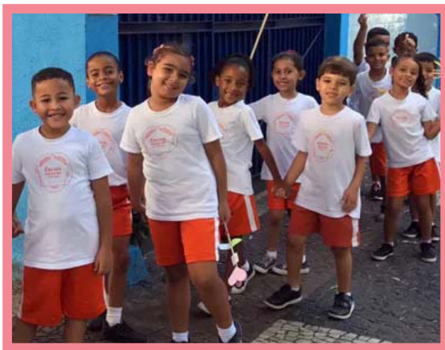
Op 23 april 2023 liepen kinderen van de Sathya Sai School van Vila Isabel in Rio de Janeiro, Brazilië, in hun buurt en maakten ze de toeschouwers blij tijdens een opwekkende Loop voor Waarden!