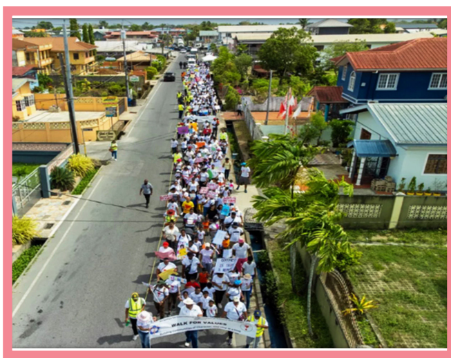
Op 6 mei 2023 organiseerden 5 Sathya Sai Scholen in Trinidad en Tobago hun eerste Loop voor Waarden- en Milieumarkt. Het thema van het evenement waaraan meer dan 350 mensen medededen, was "Bouwen aan een samenleving met Karakter, één stap tegelijk".